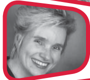
Prof. Dr. Petra Drewer

Strukturieren (Teile des tekomp-Pflichtbausteins 3), Online-Dokumentation (tekomp-Wahlbaustein 11), XML (Teile des tekomp-Pflichtbausteins 3)